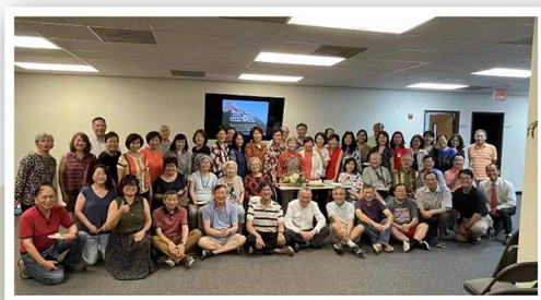
Sumiwyaty印尼姐姐事工分享