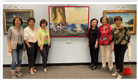
長者團契與油畫作者[左二]共享主恩