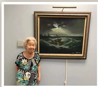
九旬耄耋長輩傾心畫作