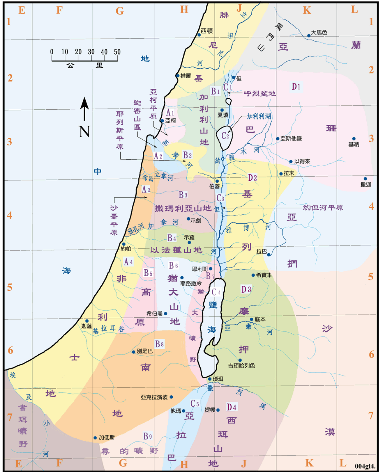
附 A：地圖（迦南地的自然區域 Geographical regions of Canaan，聖光聖經地理資訊網）